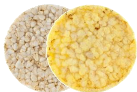
Rijst- en maiswafels